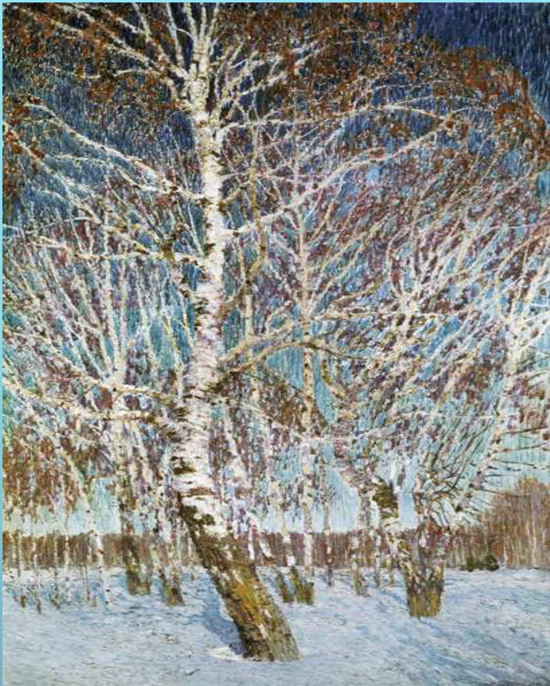
И. Э. Грабарь «Февральская лазурь»